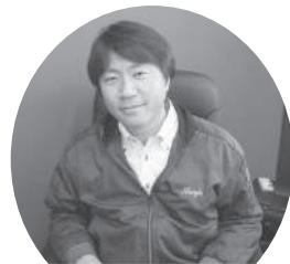
安房住宅設備機器(有)

あの時はこんな事に困った！こうしてくれたら良いな！今こんな事を心配している！等など、、、貴重なご意見がありましたら事業の糧とさせていただきますので、是非とも教えてもらいたいと思っております。よろしく願いいたします。