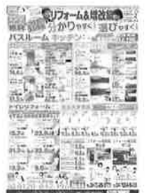
新聞折込広告です。

弊社では無料にて点検も実施させていただいておりますので、 お気軽にお声がけいただけますようよろしくお願い申し上げます。