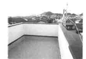
バルコニーからの景色です。