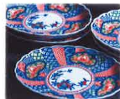
お勧めの有田焼です。