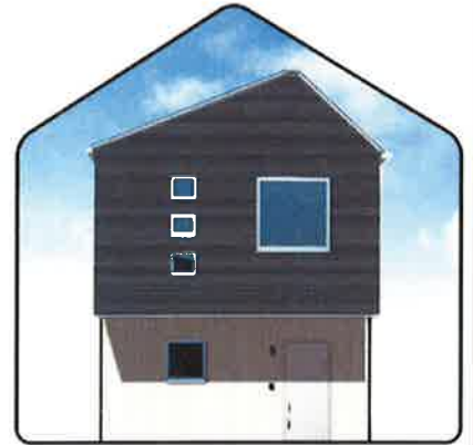
Estudio エストゥーディオ