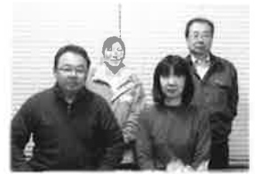
館山市 T様と記念撮影