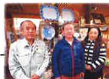
社長様、奥様と記念撮影 させて頂きました。