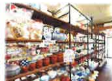
店内には沢山の素敵なお 陶器が並んでいます。