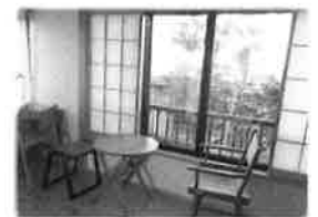
日当たりが良くなりとても明るい2階になりました。