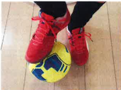
派手な靴でフットサルをしています。

グループ会社の(有)南房浄化槽サービスより、昨年末移動してまいりました。まだまだ勉強中の事も多く、営業部の先輩方のようにはいきませんが一人一人のお客様との出会いを大切に、みなさまと長いお付き合いをしていただけるように全力で対応いたします。