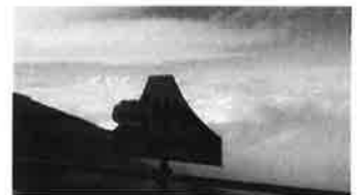
8合目からの眺め (海拔 3250m)

さて、2017年の取り組みですが、不動産事業を開始して早いもので一年半が過ぎようとしております。人員や環境も整い本格稼働といった感じです。