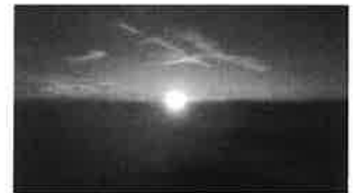
ご来光の写真です。