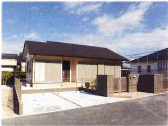
庭には木や花を植えて家庭菜園のスペースもとりました 車も2台駐車できます