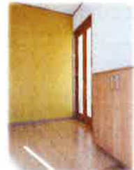
玄関も広々しています