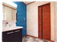
各部屋ごとにテーマがあり クロスは1面だけ色を変えて アクセント貼りをしています