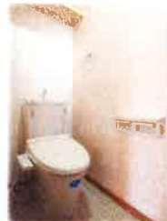
LIXILさんの100年 クリーントイレです