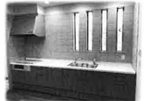
明るく広々とした空間のキッチン