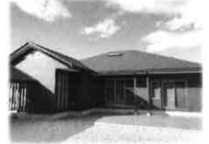
館山市 F 様