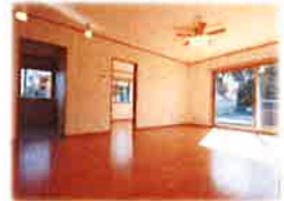
広々としたLDK! 陽当たりもよく明るい雰囲気です。