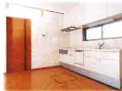
真っ白なキッチンがキレイです