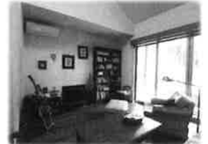
素敵な家具と趣味のギターを飾られている開放的なLDK