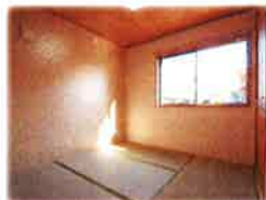
畳の部屋が1部屋あると嬉しいですね