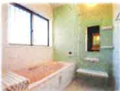
暗くなりがちなお風呂は パステルカラーで明るく 仕上げました