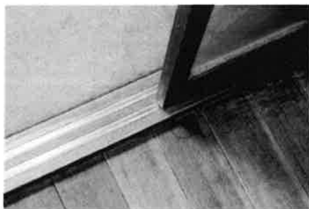
敷居の溝にVレールをはめ込みました

思い切って戸車を取付け、敷居の溝にVレールをはめ込みます。 そうするとスムーズに戸の動きが軽くなります。