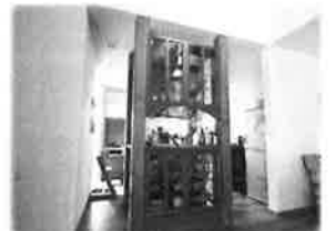
移設された素敵な食器棚