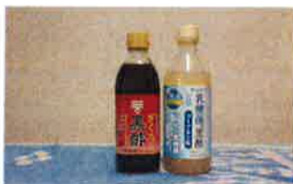
今ハマっているフルーツ酢です

これから色々なお仕事を覚えて、お客様のお役に立てるよう、努力していきたいと思っておりますので、よろしくお願い致します。