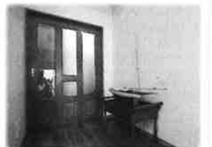
移設された大きな建具