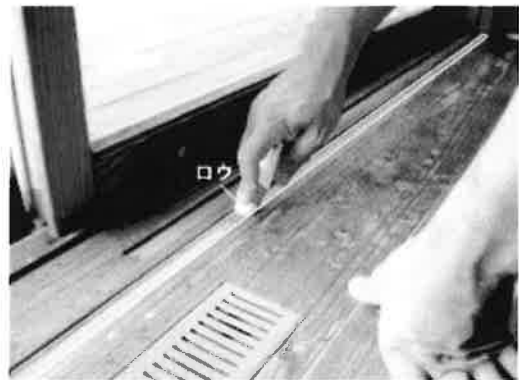
敷居の溝にロウソクを塗ります

建具がツルツルと滑りやすくなります。 敷居滑りを貼るとかシリコンスプレーを吹く等の方法も ありますが、ご自宅にロウソクがあれば これが一番簡単で、お手軽にできてしまいます！