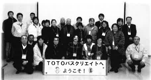
みんなで記念撮影！

先日、お客様と共に、『TOTOバスクリエイト佐倉工場 & 木更津ショールーム』の見学にバスで行ってまいりました。当日は工場をご見学後、関東地方では有数の参詣人を集める著名な寺院、成田山新勝寺で初詣をしました。やはりこの時期は沢山の方で賑わっていますね。そして、次にTOTOさんの木更津ショールームへ。工場さんで生産の過程を見学させて頂いた商品をゆっくりと見ることができ、沢山のみなさまともお話することができました。