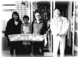
オーナーのご夫婦と記念撮影！