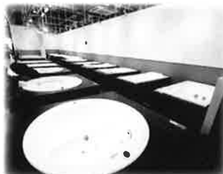
オシャレな浴槽が沢山！