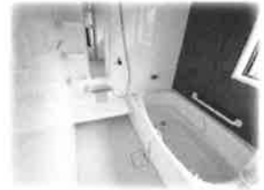
湯冷めの心配もなくなったシステムバスルーム