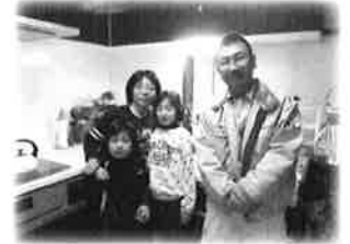
南房総市S様と記念撮影