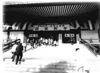
成田山新勝寺で初詣