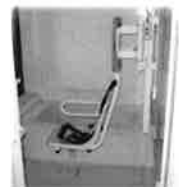
安全なリフトのついた浴室です。