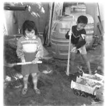
ミキと一緒にダンブに砂を積んでいました！