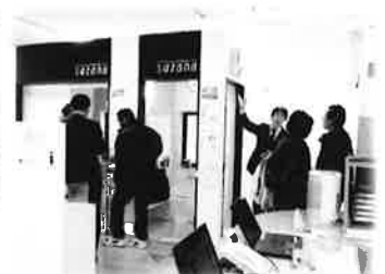
ショールームで実機展示品を見学