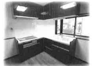
子供達の様子が目に届くL型キッチン