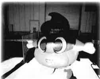
TOTOのゆるキャラ、うんちゃん！

先日、お客様と共に、『TOTOバスクリエイト佐倉工場 & 木更津ショールーム』の見学にバスで行ってまいりました。当日は工場をご見学後、関東地方では有数の参詣人を集める著名な寺院、成田山新勝寺で初詣をしました。やはりこの時期は沢山の方で賑わっていますね。そして、次にTOTOさんの木更津ショールームへ。工場さんで生産の過程を見学させて頂いた商品をゆっくりと見ることができ、沢山のみなさまともお話することができました。