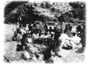
お花見楽しかったです！！