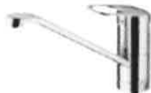
シングルレバー水栓 （ノーマルタイプ）