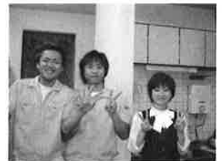
(株)不二精工様に勤めていた時の 仲間達です。(真ん中が私です。)