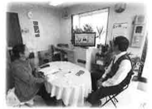
南房総市M様と記念撮影