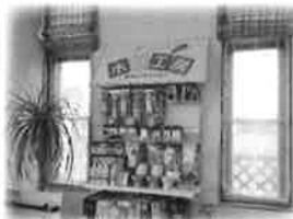
水彩工房~部品コーナー~