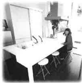
あこがれのアイランドキッチン