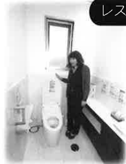
こだわり派のあなたへ びったりなトイレ