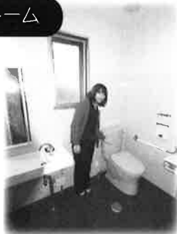
お手入れラクラクトイレ

このシステムキッチンのIHクッキングヒーターは実際に 使用できるようになっております。