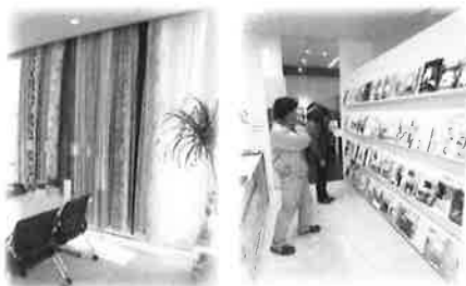
カーテンの展示サンプル