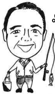
ニックネーム：あさやん