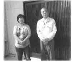
鴨川市 S様と記念撮影