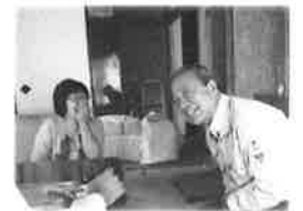
S様と楽しいインタビューでした。