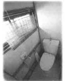
節水型のトイレを設置していただきました。