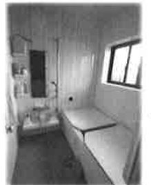
浴室もシステムバスへ改修、暖かくなりましたと喜んで頂きました。