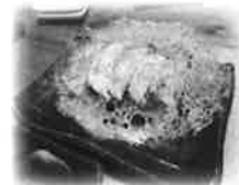
大きな羽根つき餃子