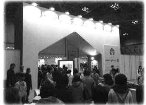
グリーンリモデルフェア2013