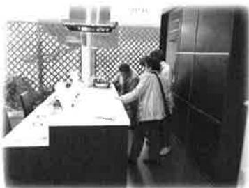
力をかけずに開けられる引出し