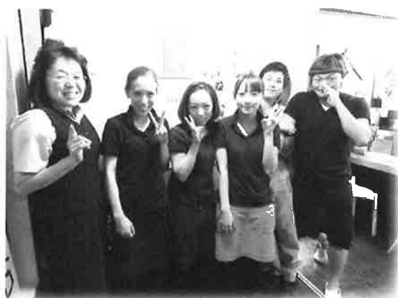
店長さん スタッフさんと記念撮影！！