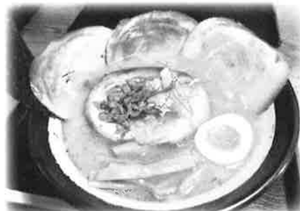
チャーシューメン