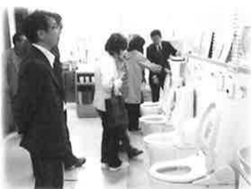
トイレがたくさん！