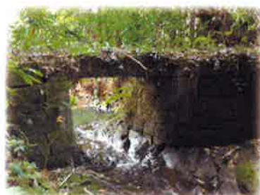
透き通った綺麗なお水です