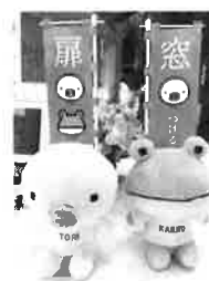
相談館の入り口で皆様をお迎えさせていただきます！