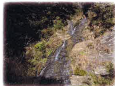
約20mくらい上から滝が流れています

これからの季節、地形図を頼りに忘れられた古道や遺跡、自然豊かな南房総の照葉樹林を歩いてみてはいかがでしょうか。