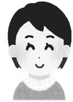
南房総市 I 様