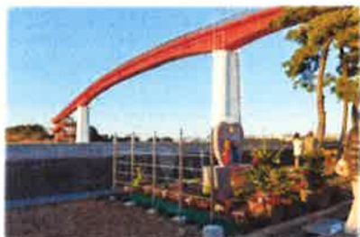
これは私の地元の写真です。中の島大橋/木更津市

リフォームからリノベーション土地探しから新築までワンストップで お任せください！