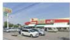
▲スーパー「ときわや」より徒歩3分