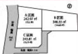
◀セブンイレブン「館山高井店」より徒歩1分