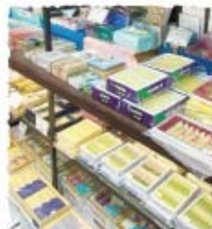
珍しい商品が並ぶ「お線香コーナー」

味わっていただければ嬉しいです。」最近では高齢の方から、高校生などの若い方まで、幅広い層の方が来店されています。更に、日本陶芸チェーン加盟店に加入している為、陶磁器、漆器、ガラス、金属、ギフト返礼品、お香お線香に至るまで送料が安いことも魅力です。お客様ひとりひとりの「ニーズ」に少しでも応えていただけるお店です。